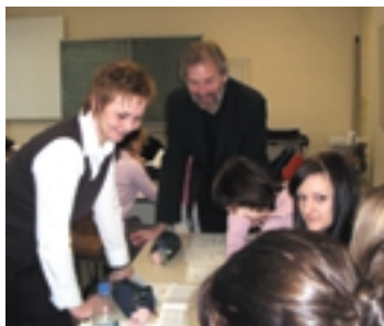
Training: Richtig Bewerbung schreiben!

Anschließend konnten die Schülerinnen und Schüler wählen zwischen Informationsangeboten aus den Bereichen ‚Nach der Schule ins Ausland‘, ‚Ausbildung bei der Polizei‘, ‚StudiumPlus‘, ‚Ausbildung zum Steuerfachgehilfen bzw. Steuerberater‘ und einem Wegweiser durch die kaufmännischen Ausbildungsberufe. Auch ein Beratungsangebot für diejenigen, die überhaupt noch keine Vorstellung von ihrem künftigen