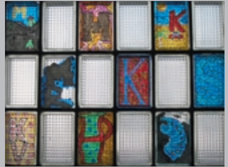
Künstlerisch gestaltete Glasbausteine im Haus B

Liebe Freunde, liebe Förderer, liebe Ehemalige der Friedrich-Feld-Schule!